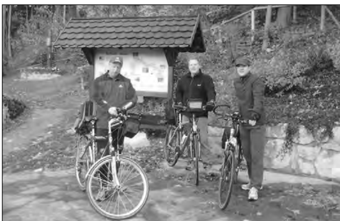
Am Start in Kefferhausen