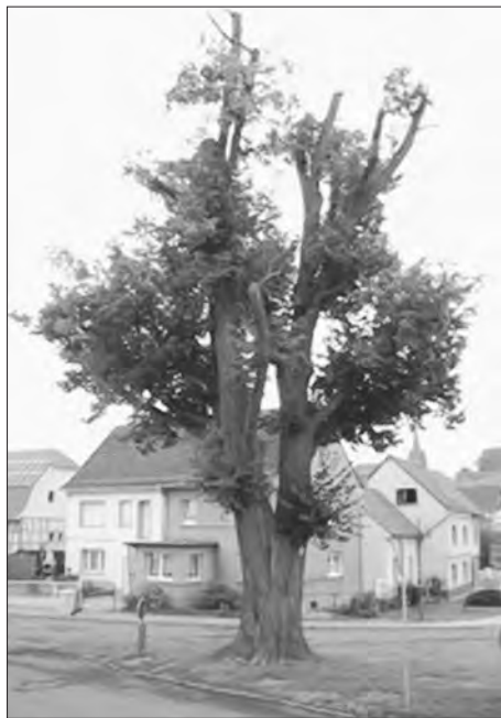
Backstorlinde am 30. Juli 2010

Für unsere Einwohner und deren Vorfahren sind mit dieser Linde viele Erinnerungen verbunden. Die Linde ist ein lebendes Naturdenkmal.