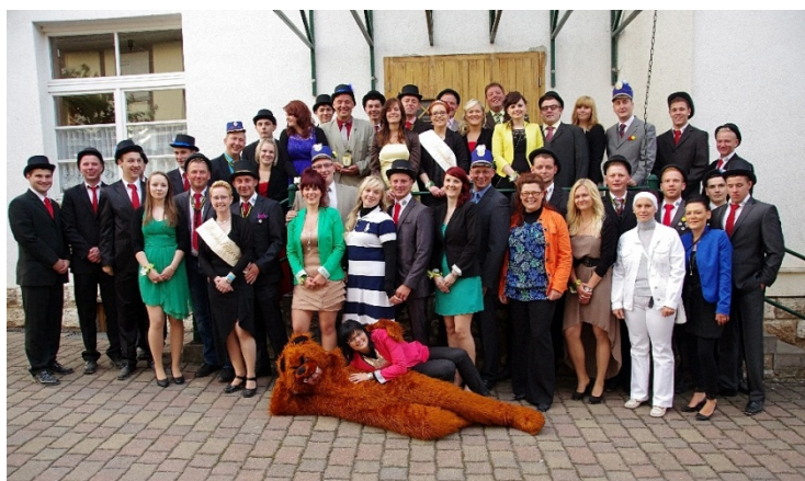
Die Ammersche Kirmesgesellschaft e. V.

Wir sind die ERSTEN in der Gemeinde Unstruttal, die in jedem Jahr ihre KIRMES feiern