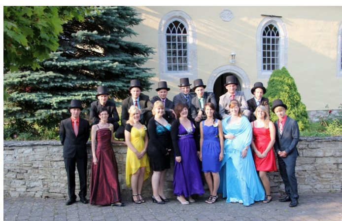
Der Kirmesverein Reiser e. V.