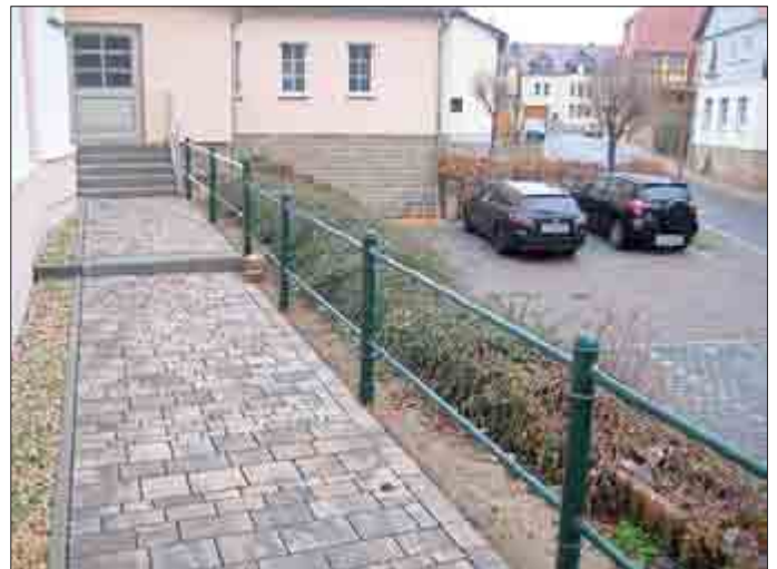
Sanierung der Trauerhalle in Horsmar