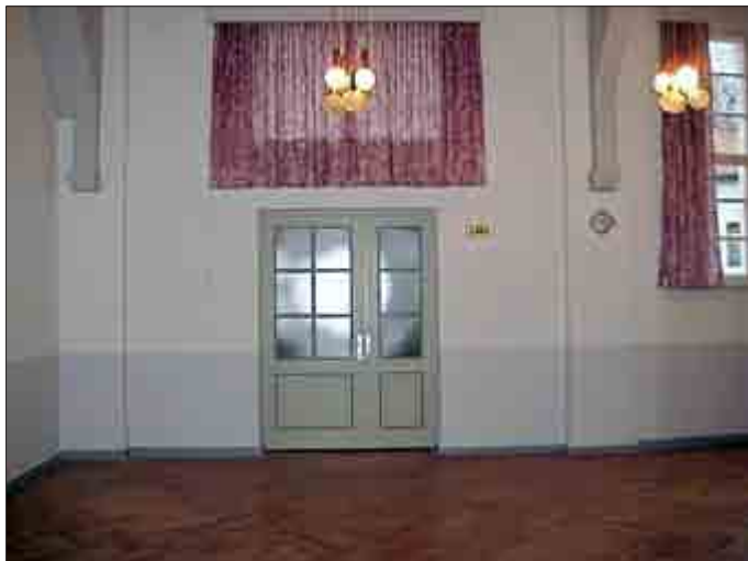
Sanierung der Trauerhalle in Dachrieden