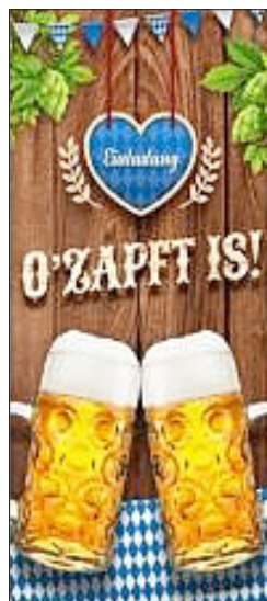
Der Vorstand des ACC Ammern

Wenn ihr Lust habt, dann seid ihr herzlich willkommen. In Dirndl und Lederhose feiert sich so ein typischer Frühschoppen nochmal so schön. Die Ammerschen Närrinnen und Narren freuen sich auf Euer Kommen.