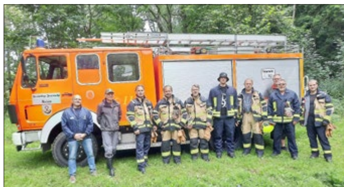
Kameraden der Freiwilligen Feuerwehr Reiser an der Quelle

An dieser Stelle wird darauf hingewiesen, dass sich die Brunnenkressquelle auf privatem Grund und Boden befindet. Alle Bürger werden angehalten, der Aufsichtspflicht gegenüber Kindern und Haustieren nachzukommen. Absperrungen sind einzuhalten, es besteht Unfallgefahr!