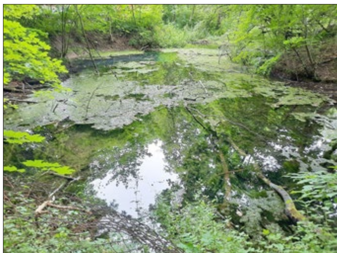
Reisersche Quelle / Brunnenkressquelle

Eine aktuelle Wasserprobe der Brunnenkressquelle Reiser wurde am Samstag, d. 17.07.2021 entnommen. Dazu wurde die Freiwillige Feuerwehr Reiser um Unterstützung gebeten, was gleichzeitig ihrer Ausbildung und dem Kennenlernen eines möglichen Gefahrenortes diente. Der Rand der Quelle und der Untergrund sind rutschig und Personen könnten dort leicht einsinken. Daher wurden die Absicherung und das koordinierte Vorgehen an und in der Quelle schon vorab besprochen und festgelegt.