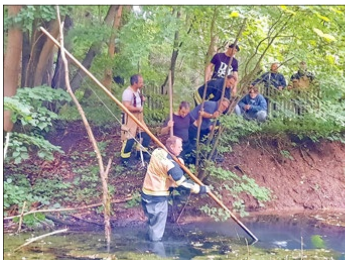
Entnahme der Wasserprobe durch FFW Reiser

Es kam darauf an, die Wasserprobe an dem untersten Wasserzulauf, in etwa 3 - 4 Meter Tiefe zu entnehmen, um die Reinheit der Probe zu erreichen. Mit Hilfe eines langen Einreißhakens der Freiwilligen Feuerwehr wurden nacheinander zwei große Gläser mit der Wasserprobe befüllt, nachdem die als Abdeckung genutzte Folie eingestochen wurde. Dadurch soll in der später folgenden Wasseranalyse ein Vergleich zu den 1983 veröffentlichten Ergebnissen (vgl. Teil 2) gezogen werden.