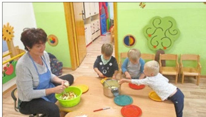
Die älteren Kinder bereiteten u. a. Obstsalat zu und buken einen leckeren Apfelkuchen.

Für Eigenrode ist das Ev. Pfarramt Rüdigershagen , Tel. 036076/59764, E-mail: ev.pfarramt-ruedigershagen@t-online.de oder conny-hartmann@gmx.de zuständig.