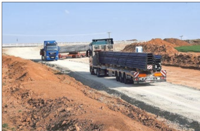
Schwerlasttransportfahrzeuge transportieren große Metallteile für Spundwände und eine Behelfsbrücke bei Reiser