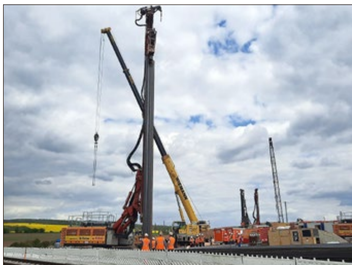
Bau der Spundwände und der Behelfsbrücke durch die ARGE bei Reiser

Anfang Mai wurde die Bahnstrecke zwischen Bad Langensalza und Dachrieden für mehrere Tage gesperrt. Grund dafür ist der Brückenbau zur späteren Unterquerung der Bahnstrecke durch die neue B 247n. Wie der private Bauträger der Ortsumgehungsstraße, die Via Mühlhausen informierte, musste dafür erst eine Behelfsbrücke gebaut werden. Bei jener von Reiser seien wegen der dort vorgefundenen Bodenverhältnisse zusätzliche Arbeiten nötig geworden. Die Bahn musste dementsprechend auch den Schienenersatzverkehr auf der Strecke etwas verlängern.