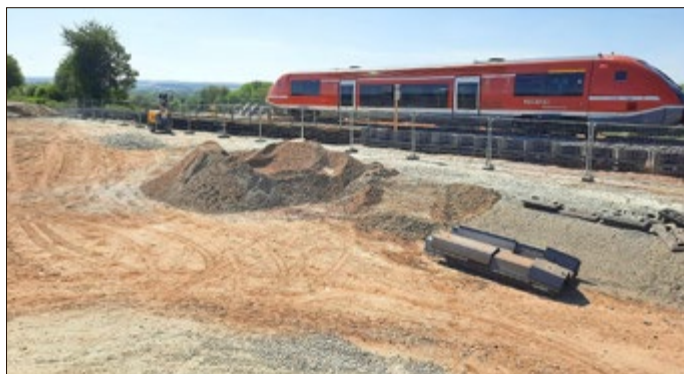
Bahnverkehr über die Baustelle bei Reiser

Jetzt sind die Schienen an der Stelle der Bahnstrecke neu verlegt und der Bahnverkehr ist wieder eingerichtet.