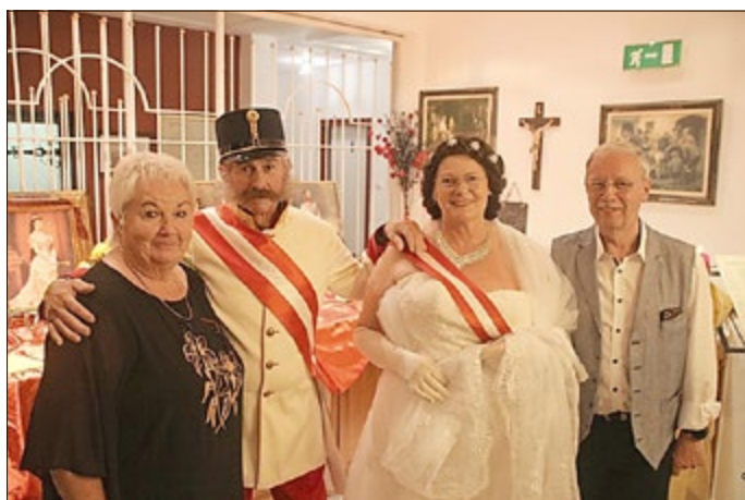
Fotoshooting mit dem Kaiserpaar

Mit der Reiseleitung besichtigten wir die herrlichen Kirchen am Friedhof und das Grab von Toni Sailer. Unser Weg führte uns in die Altstadt, wo es für jeden genügend Freizeit gab. Von Kitzbühl fuhren wir über Hochfilzen, mit kurzem Stopp im Biathlonstadion, zurück nach Maria Alm. Zum Abendessen zelebrierte die Chefin den Kaiserabend mit einem DJ und festlicher Deko durch. Das „Hoch“ zum Empfang wurde geübt und es erschienen die Majestäten Kaiserin Sissi und Kaiser Franz. Ein Fotoshooting mit dem Kaiserpaar schloss den Auftritt ab.