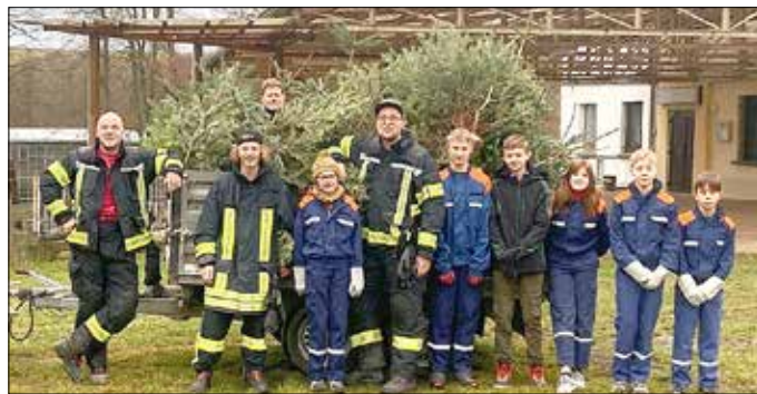
Der Vorstand der Freiwilligen Feuerwehr Dachrieden

Am Nachmittag und Abend bekamen wir auch von der Jugendfeuerwehr große Unterstützung, die einen eigenen Stand hatte. Ein großer Dank an alle großen und kleinen Helfer, die uns diesen schönen Tag ermöglicht haben. So konnten wir den Abend gemütlich am Feuer bei lecker Essen und Glühwein ausklingen lassen.