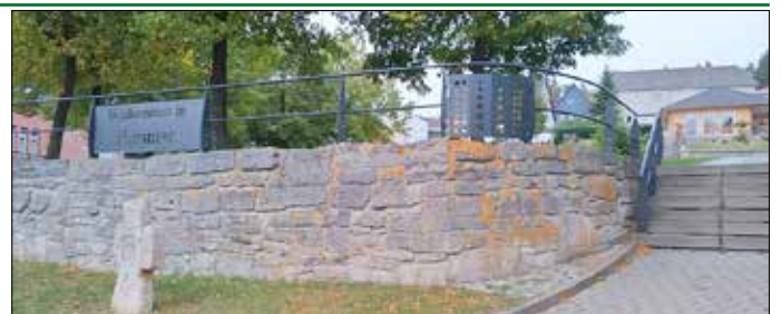
Geländer auf der Angermauer