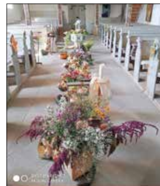
(geschmückte Kirche)

Herzliches Dankeschön im Namen des Gemeindegemeinderates M. Hündorf